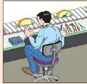
Χρήση εσοχής για να πλησιάσουμε την επιφάνεια εργασίας