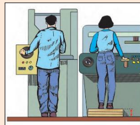
Χρήση πλατφόρμας για να αυξήσουμε το δάπεδο εργασίας