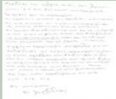
Καταγραφή ιδεών βελτίωσης από εργαζόμενο Σημ. Οι φωτογραφίες είναι σκόπιμα δυσανάγνωστες.

Ο ΠΑΤΡΙΑΡΧΗΣ του Lean Manufacturing Dr Shigeo Shingo, στον οποίο οφείλεται η παγκόσμια εξάπλωση της φιλοσοφίας αυτής, μεταξύ των άλλων είπε: